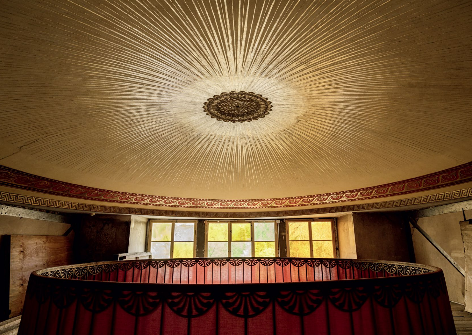
Das magische Auge im Gentzsch Treppenhaus: der Okulus aus der Nähe