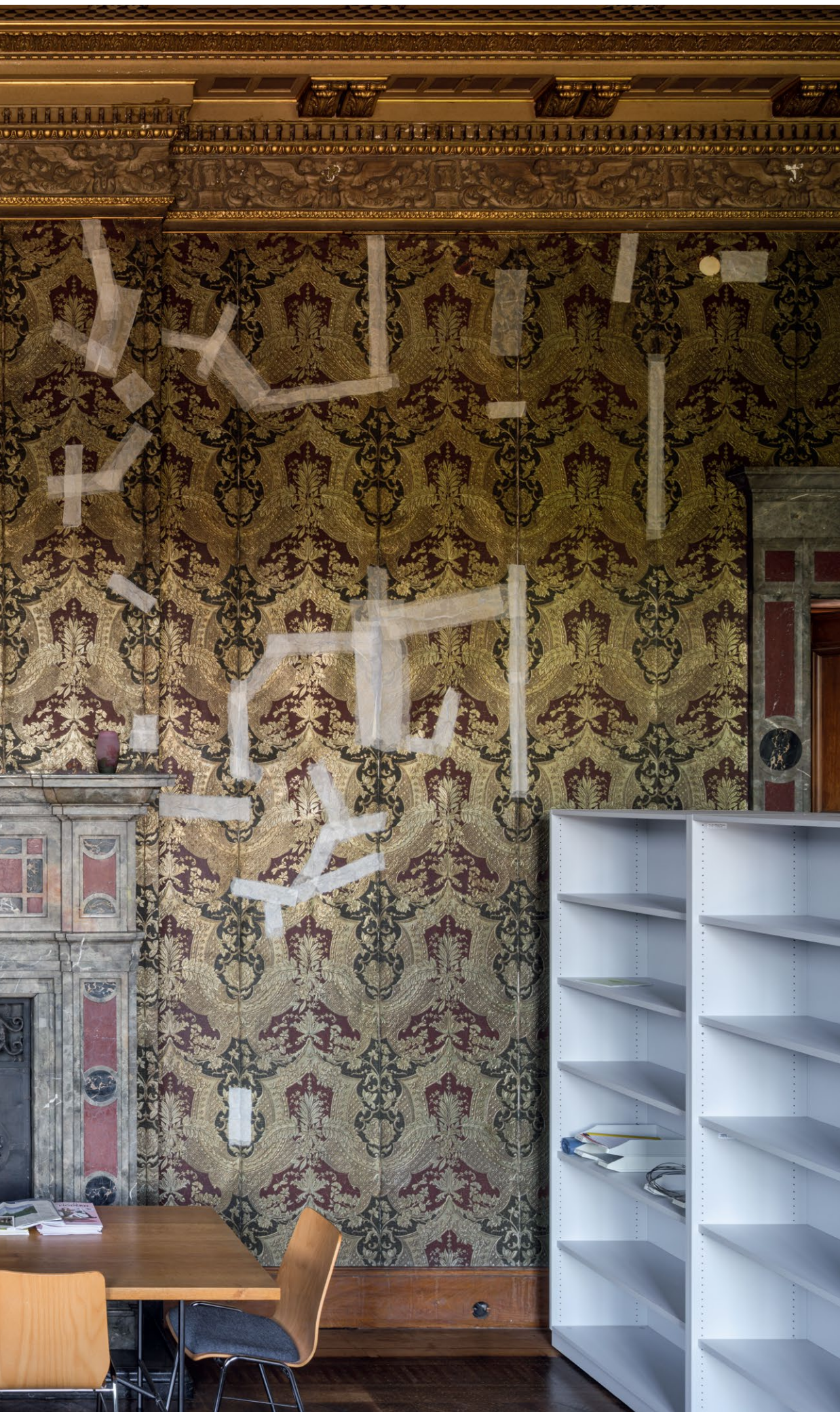
Wohnen 1916: Prägetapeten aus Leder im Südflügel und aktuelle ambulante Maßnahmen