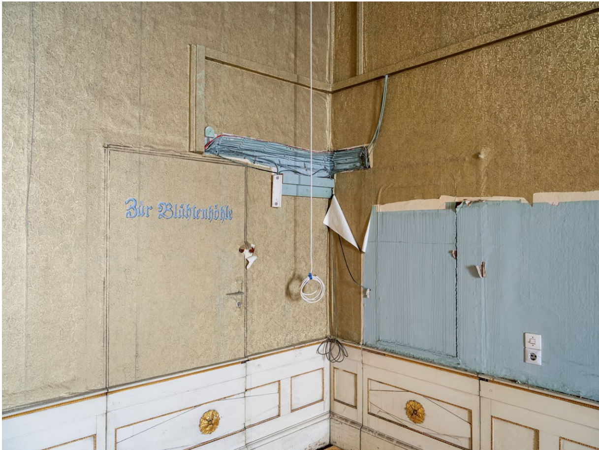
Eine geheimnisvolle versiegelte Tapentür in der Beletage des Ostflügels