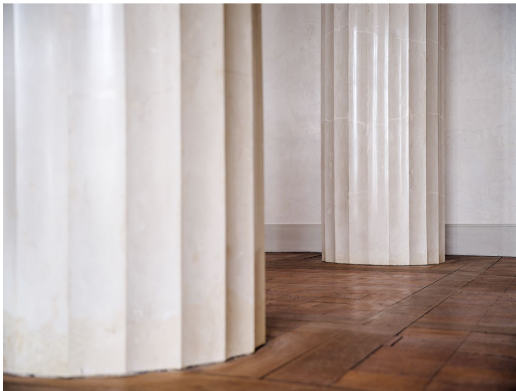
Goethes Handschrift: Säulen ohne Basen im Gentzschen Treppenhaus